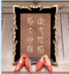
▶福德稲荷神社拝殿にある上杉鷹山自筆の社額(複製)