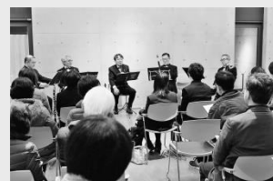
2月28日開催 「第19回ウッディコンサート クラリネット五重奏」の様子