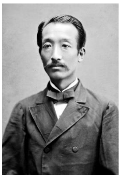
米沢市上杉博物館蔵

日時：4/14(日), 5/19(日) 13:30~15:00 場所：ナセBA1階 体験学習室