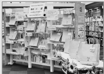
本のお楽しみ袋書架

テーマにそって選んだ本を3冊パックにして、本のお楽しみ袋を作成し、フェア期間中、一般特集コーナーの棚で開催しました。中の本は借りてみてからの楽しみ。「たんけん」「いきもの」「こころ」などのジャンルごとに、幼児・小学校低学年・小学校高学年の対象年齢別に本を選びました。また、お楽しみ袋の一部は、家族みんなでお家で楽しんでもらえるよう、同じテーマで子ども向けと大人向けを用意した6冊パックも準備しました。