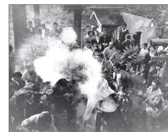
湯立て(笹野山神社)

菊地秋良氏の写真集『ふるさとのかたちとまつり—置賜地方の歳時—』より、昭和40～50年代の米沢に暮らす人々のハレ(お祭などの非日常)の場を紹介いたします。