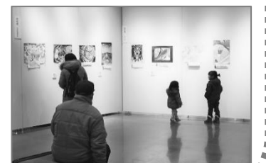
昨年の読書感想画展の様子