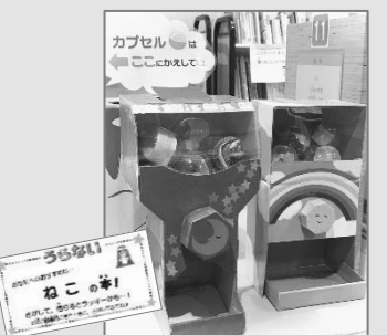
オリジナルガチャガチャ

はじめての企画でしたが、大変好評でフェア期間中準備した本の8割が借りられました。お楽しみ袋におすすめ内容のカードをつけていましたが、そちらにコメントが添えられて戻るといううれしいこともありました。