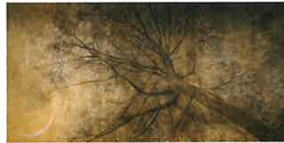
三日月 2005年 再興第90回院展