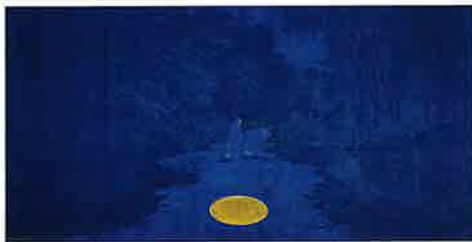
月の鏡 1994年 再興第79回院展