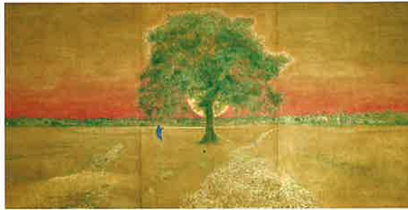
稼穡望郷 陽昇る 1993年 第48回春の院展