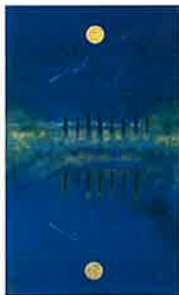
流星と月と8本の糸杉 1993年 第48回春の院展