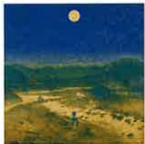
月下洗菜 1992年(個人) 第47回春の院展奨励賞