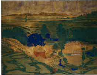
ファラフィン遠雪 1987年 再興第72回院展 日本芸術院賞 大観賞