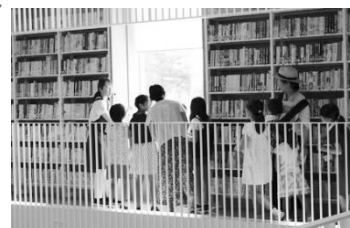
昨年のバックヤードツアーの様子

今年はお家でも楽しめるイベントを中心に、夏休み子ども図書館フェアを開催します。中身はどんな本が入っているのかな? テーマごとの本が入ったお楽しみ袋の貸出や、ミッフィー副館長のうらない付きガチャガチャ、バックヤードツアーの動画配信などを予定しています。