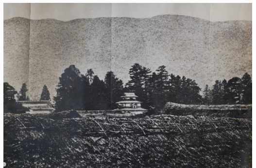
米沢城御三階写真